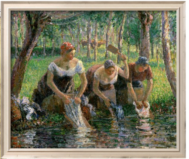
Seurat, 1895 alors qu'il vivait à Eragny sur Oise.