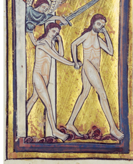
William de Brailes - Adam and Eve chassés du Paradis