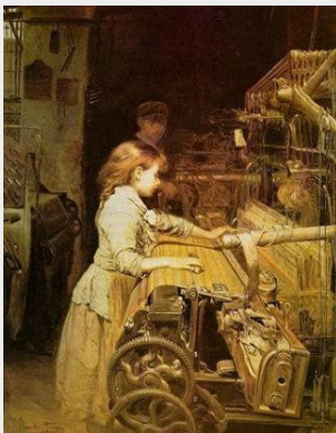
Juan Planelles y Rodriguez « La petite ouvrière », 1889