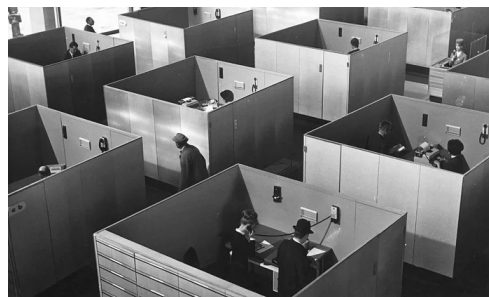
Playtime de J. Tati