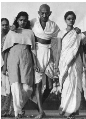
La marche du sel, 1930