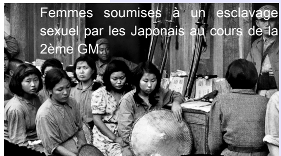
Femmes soumises à un esclavage sexuel par les Japonais au cours de la 2ème GM.

★ Associée à l'absence de maîtrise de soi.