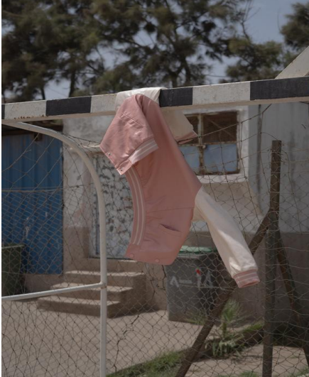
Dans la cour de récréation de Bayti, à Casablanca, le 7 août 2025.